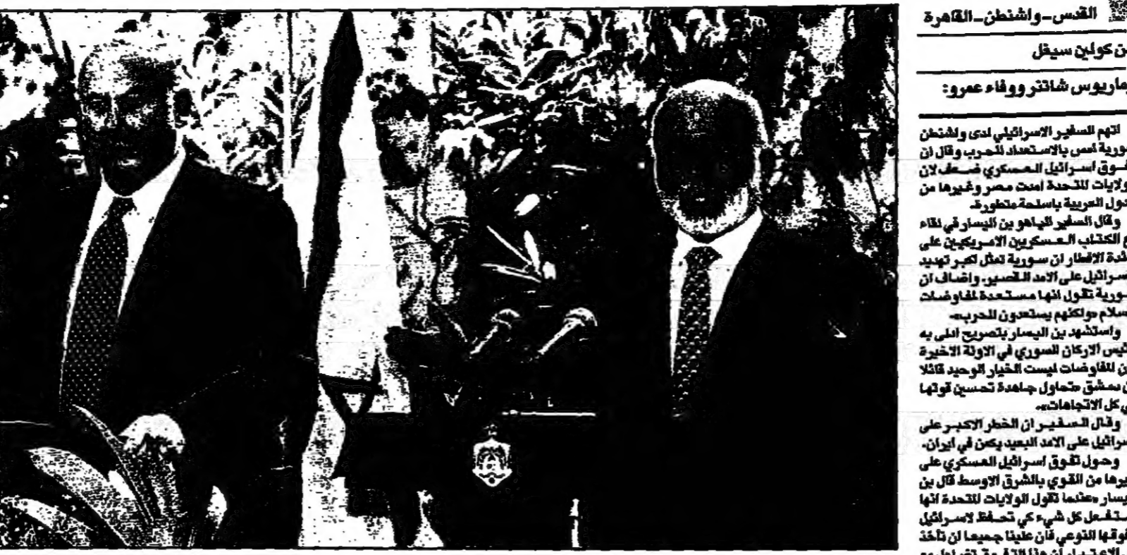
للك حسين ورئيس الوزراء الاسرائيلي يمتحن الفلسطينيين في حجة العتبة لس (دودن)

محمودية وان ثورة الجياع خطيرة أب (القدس) - قال السفير الإسرائيلي في دمشق، دودن، إن إسرائيل تتوقع أن تكون سورية معادية للولايات المتحدة في حال وقوع ثورة الجياع في سوريا. وقال دودن إن إسرائيل تتوقع أن تكون سورية معادية للولايات المتحدة في حال وقوع ثورة الجياع في سوريا.